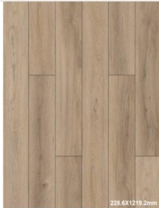
SÁNDALO Piso SPC Laminclick