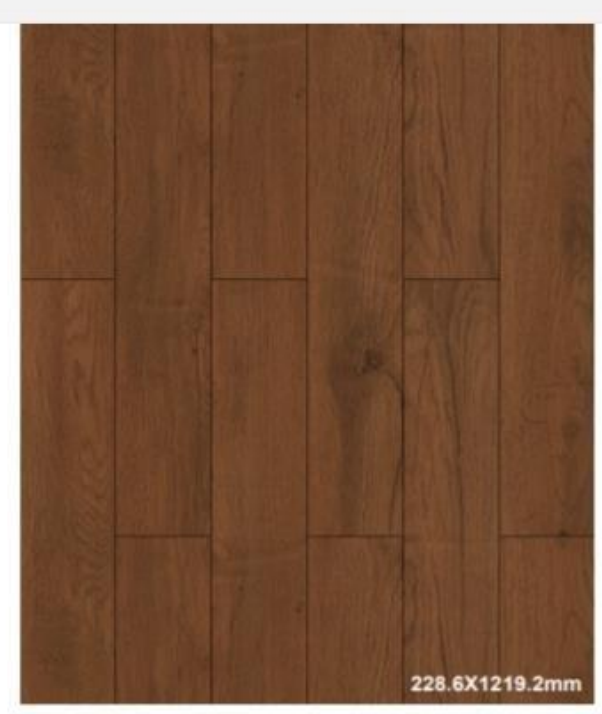
SICOMORO Piso SPC Laminclick