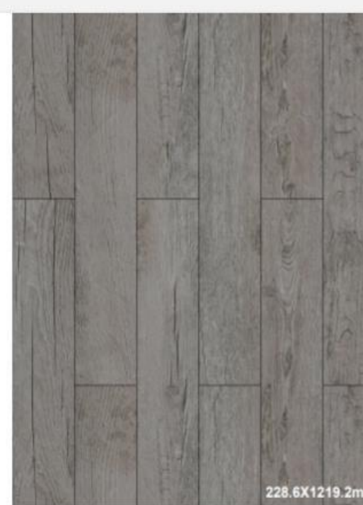
CENIZO Piso SPC Laminclick